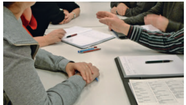
Les groupes de travail veulent convaincre la population de la plus-value de cette fusion.

Les groupes de travail du processus de fusion Béroche-Bevaix planchent sur les différents points qui vont figurer dans la Convention. Le nom de la future Commune et son armoirie font actuellement l'objet d'une démarche participative à laquelle chacun peut prendre part.